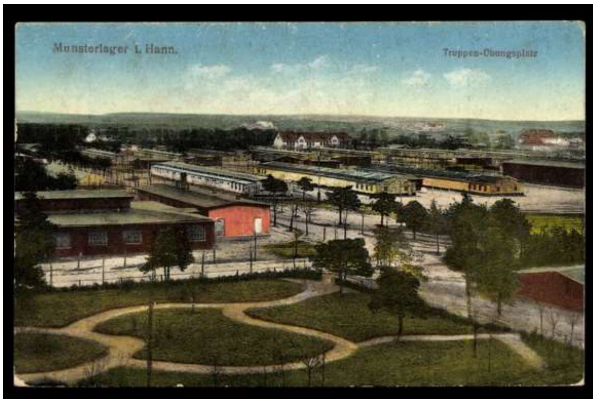
Le camp de prisonniers de Münster (Allemagne)